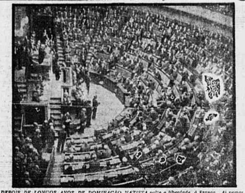
DEPOIS DE LONGOS ANOS DE DOMINACAO NAZISTA volta a liberdade a França. Ai vemos o sessão de instalação de sua Assembleia Constituinte, com o recinto completamente cheio.