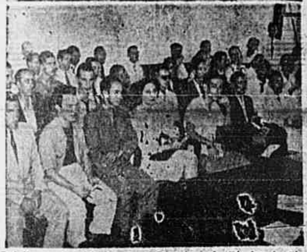
Trabalha-se com entusiasmo no Departamento Técnico do Sindicato dos Bancários. Velhos e novos militantes sindicais, homens e mulheres, desenvolvem constante atividade. Durante o dia de ontem, realizou-se, também, uma assembleia das comissões do Sindicato, da qual reproduzimos em baixo, um aspecto

Está em mãos do sr. Carneiro de Mendonça a solução imediata do conflito que sua intransigência provocou, arrastando os bancários à greve. Demitir-se o ministro do Trabalho, e o caminho ficará aberto para o entendimento entre bancários e banqueiros.