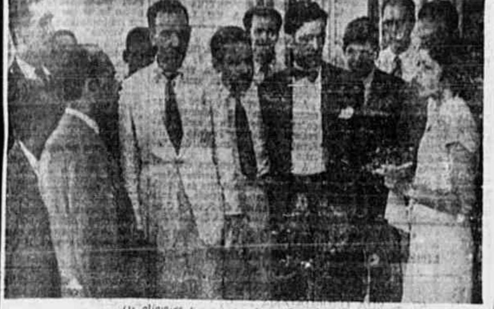
Os alfaiates queixam-se da nova legislação...